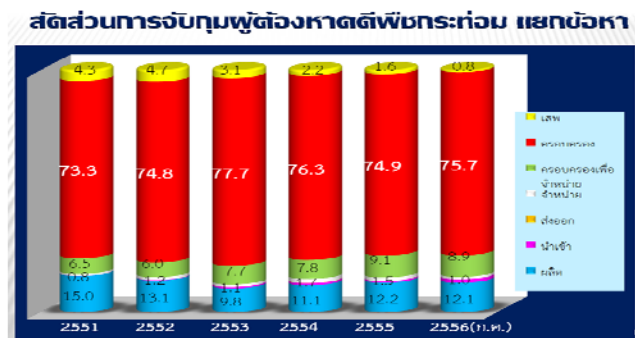
ภาพที่ 3 แสดงสถิติการจับกุมผู้ต้องหาคดีพืชกระท่อม แยกตามประเภทข้อหา ปี พ.ศ. 2551 - 2556

ภาพที่ 1 ภาพแสดงสถิติการจับกุมคดีพืชกระท่อม แยกจำนวนคดี และจำนวนผู้ต้องหา ปี พ.ศ. 2546 - 2556 จะเห็นได้ว่ามีอัตราที่เพิ่มสูงขึ้นอย่างต่อเนื่องในทุกๆปี เช่นเดียวกับ ภาพที่ 2 ภาพแสดงในสถิติการจับกุมคดีน้ำท่วมกระท่อม ก็มีอัตราที่เพิ่มสูงขึ้นได้ส่งผลต่อกระบวนการยุติธรรมทางอาญาทั้งระบบที่ต้องมีการนำคดีขึ้นสู่ศาล