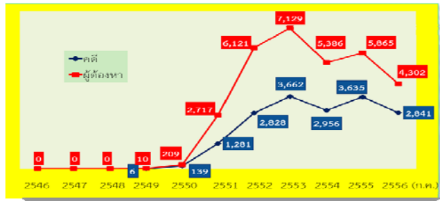
ภาพที่ 2 แสดงสถิติการจับกุมคดีน้ำท่วมกระท่อม แยกจำนวนคดี และจำนวนผู้ต้องหา ปี พ.ศ. 2546 - 2556

ภาพที่ 1 ภาพแสดงสถิติการจับกุมคดีพืชกระท่อม แยกจำนวนคดี และจำนวนผู้ต้องหา ปี พ.ศ. 2546 - 2556 จะเห็นได้ว่ามีอัตราที่เพิ่มสูงขึ้นอย่างต่อเนื่องในทุกๆปี เช่นเดียวกับ ภาพที่ 2 ภาพแสดงในสถิติการจับกุมคดีน้ำท่วมกระท่อม ก็มีอัตราที่เพิ่มสูงขึ้นได้ส่งผลต่อกระบวนการยุติธรรมทางอาญาทั้งระบบที่ต้องมีการนำคดีขึ้นสู่ศาล