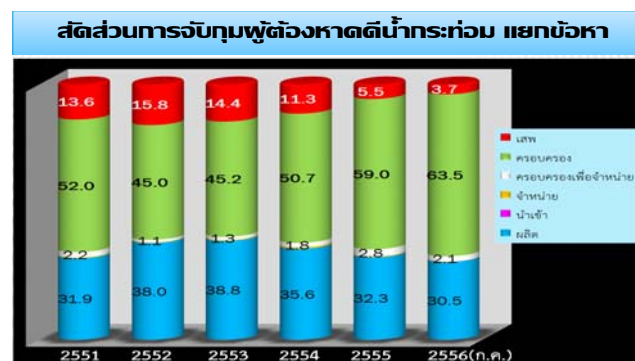
ภาพที่ 4 แสดงสถิติการจับกุมผู้ต้องหาคดีน้ำกระท่อม แยกตามประเภทข้อหา ปี พ.ศ. 2551 - 2556